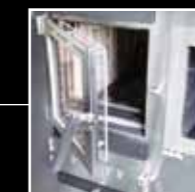
Feuertüre mit Sichtscheibe und Hitzeschild