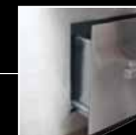
Holz Kohlewagen mit Teleskopauszug