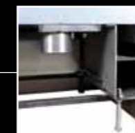
Außenluftanschluß, Schraubfüße für Höhenverstellung