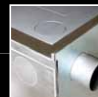
Kaminanschluß mit 6 Wahlmöglichkeiten

Durch die integrierte Brandschutzeinheit sind unsere ProHA -Herde anbaufähig.